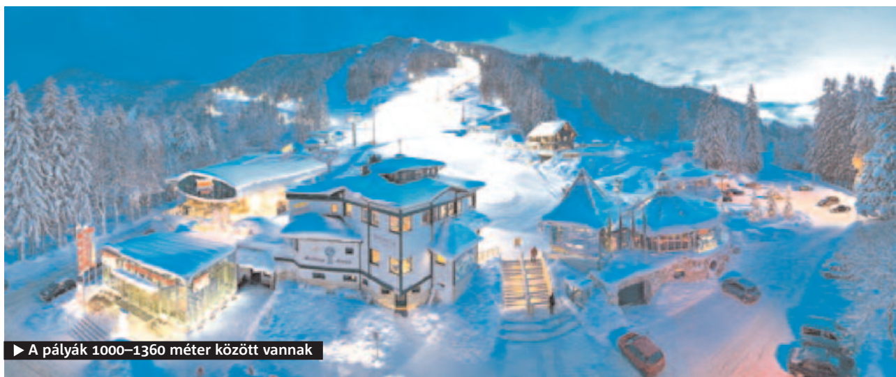
▶ A pályák 1000–1360 méter között vannak

Zauberberg Semmering (vagy ahogy a helyiek írják, Zau[:ber:]g) azért a legcsábítóbb a magyar síszerezőknek, mert 2,5 óra alatt el lehet érni egy világszínvonalú sítérpet. A megengedett leggyorsabb tempóval haladva – egy negyedórás pihenővel – 2 óra 43 perc volt az utunk Budaórstól a szállásunkig, a pályaparkolótól 100 méterre (!) lévő Hotel Sonnwendhofig.